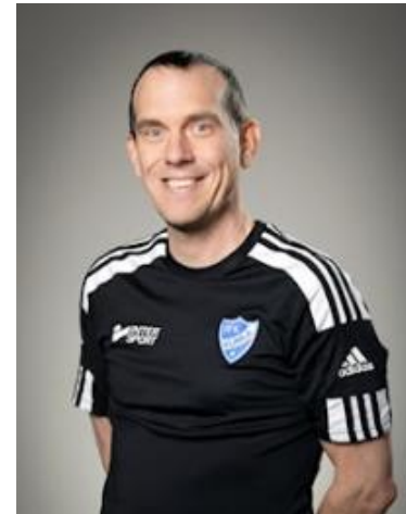
Anders Barn Tove