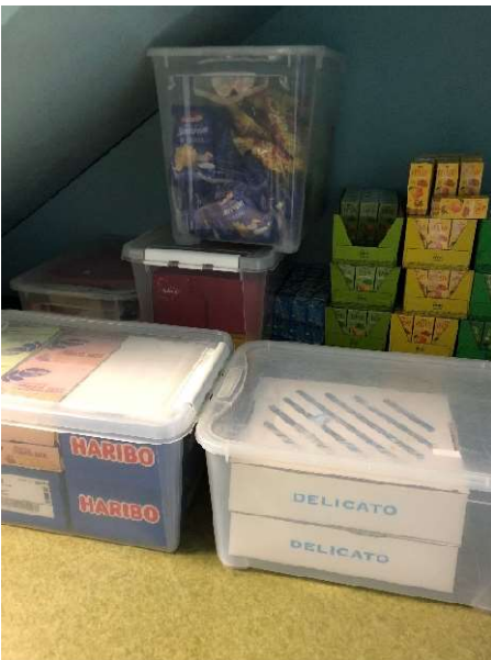
Packa alla varor i plastbackar!