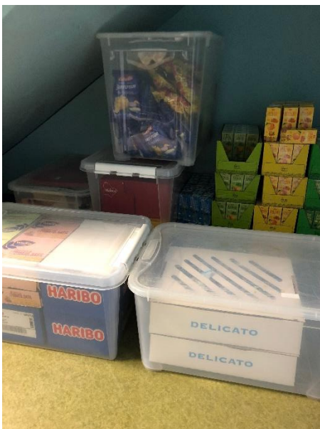
Packa alla varor i plastbackar!