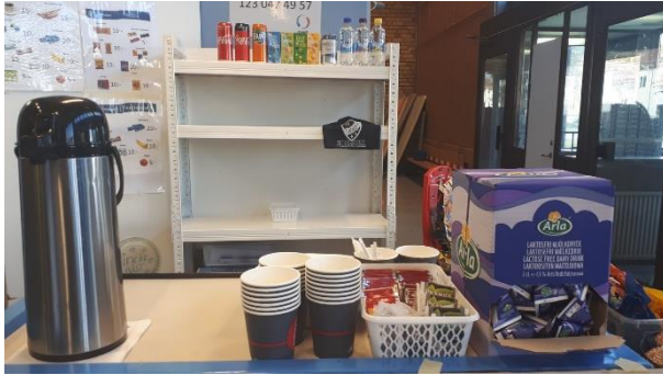
Förslag på uppställd kiosk.