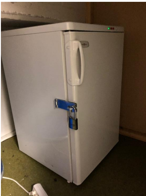
Extra frys i klisterbollförrådet för korv o bröd.