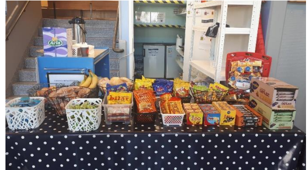
Förslag på uppställd kiosk.