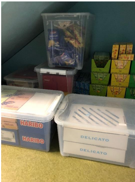
Packa alla varor i plastbackar!