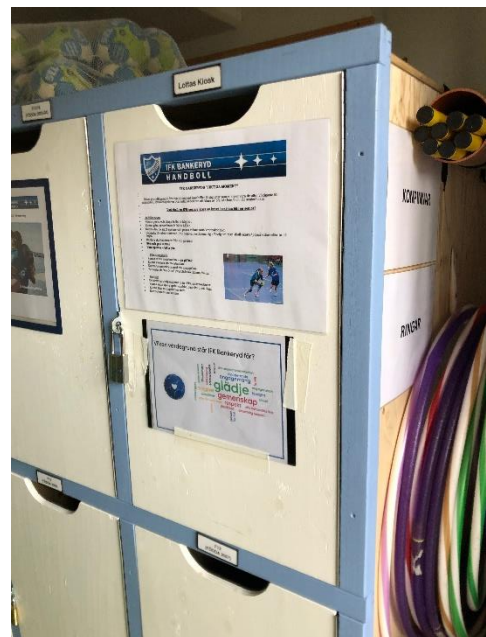
Kiosklager i andra förrådet, med filter, kaffemuggar och kakor o godis.