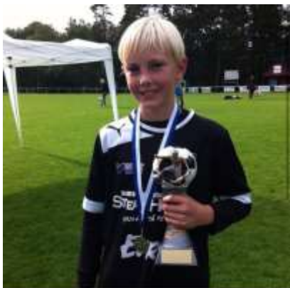
Laban med Bucklan från Habo Cup.