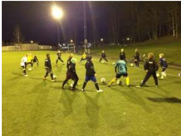
Träning på Råslätt i november med P04.