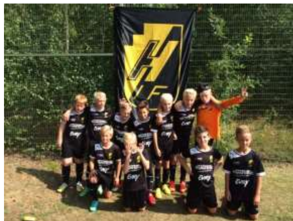
Efter het dag med tuffa matcher på Öland.