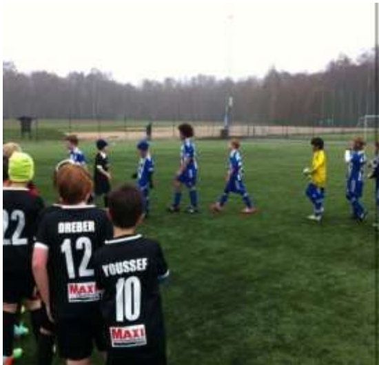
Träningsmatch mot IFK Göteborg, vi förlorade med 8-4 men spelade bra.