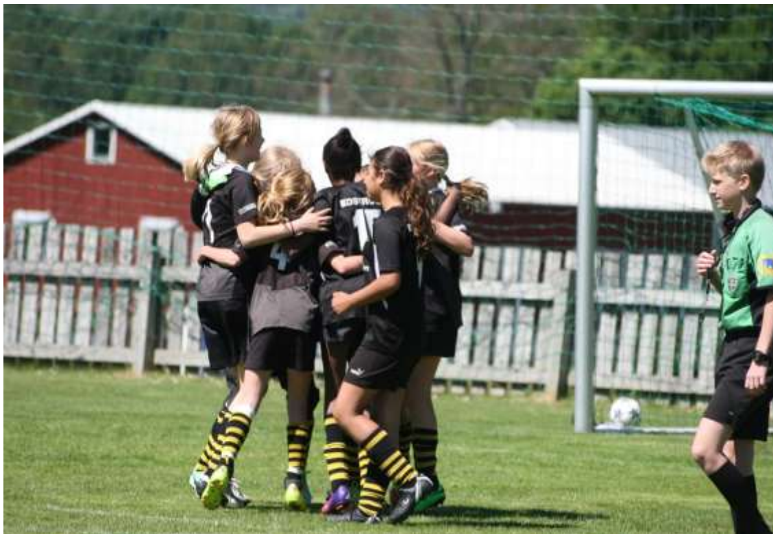
IF Haga F02 har just gjort segermålet (1-2) mot IF Ölmstad, den 14 juni.