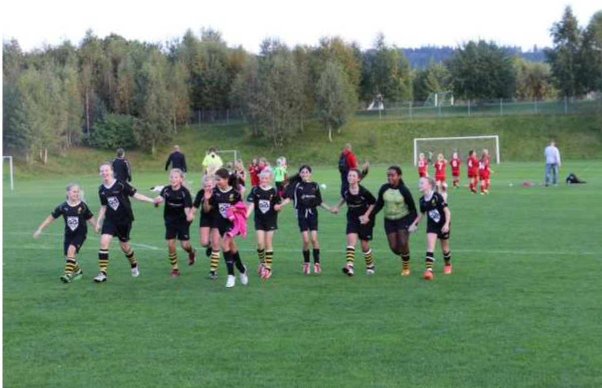
Solen trängde fram i samband med sista matchen (IF Haga – Skeninge IK 1-0)

Även detta var en stenhård kamp med många målchanser åt båda hållen. Melissa räddade allting med hjälp av hårt arbetande backar och Elvira sköt en frispark rakt i mål. Vi vann med 1-0, samtidigt som solen visade sig för första gången på cuphelgen.