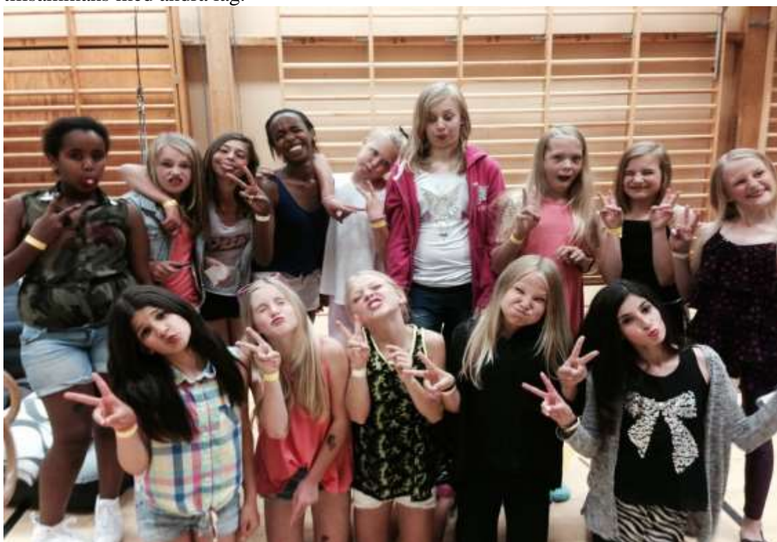
På kvällen gjorde sig spelarna fina inför turneringens disco