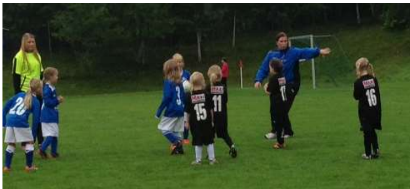
Match på Hagadagarna.

Vi är ett härligt gäng med tjejer som tillsammans med ledare och föräldrar har kul ihop!