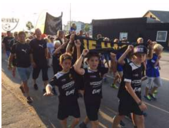
Marsch från hamnen till festivalområde på Öland