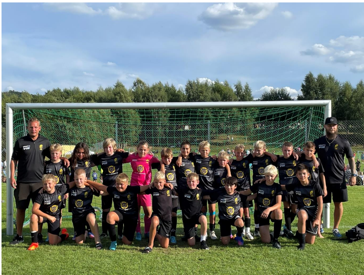
P11 under Hagadagarna.

Till vår stora glädje lyckades vi behålla merparten av våra grabbar under hela säsongen och vi står nu bra rustade för säsongen 2023.