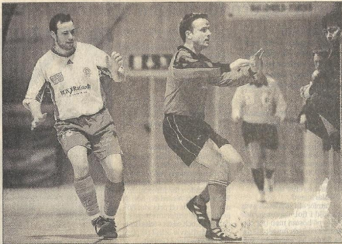
Eslövscupens herrfinal mellan Häljarp i vitt och Bjärred i rött blev en töt match. Först efter 4,47 i slutet av matchen kom avgörandet.

I den andra semifinalen besegrade Bjärred hemmafavo-