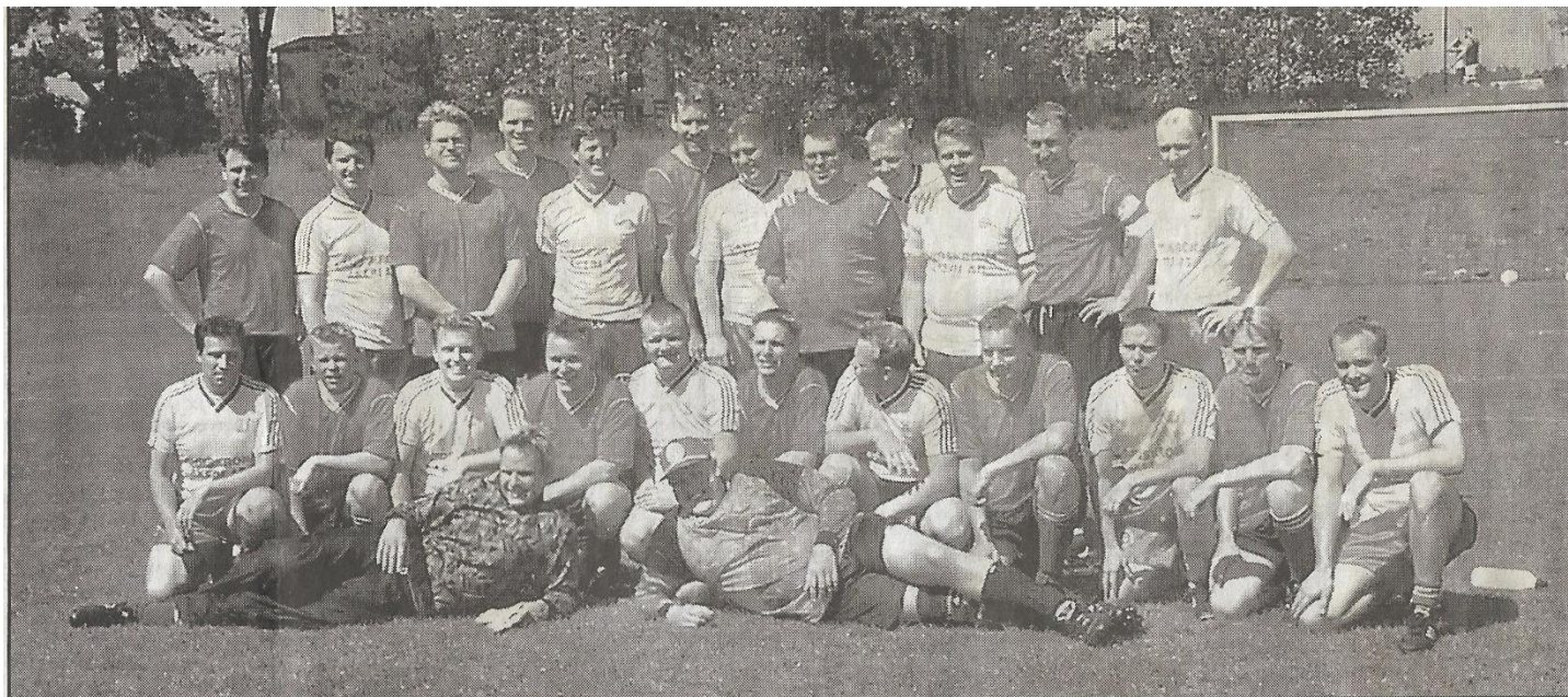
Här har båda lagen samlats för att bli förevigade.