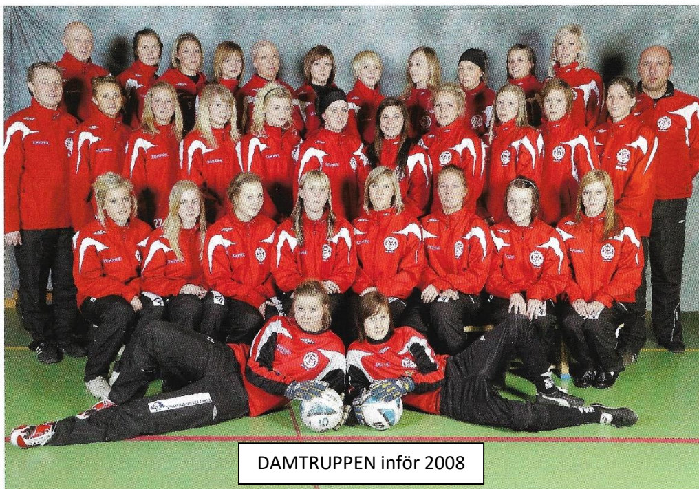
DAMTRUPPEN inför 2008