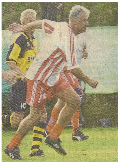
En skön bild från NST Glenn Hysén – en av Sveriges största på 1980-talet, landslagsback, proffs i England och Italien, två Guldbollar - i Häljarps IFs matchdress

På kvällen deltog ca 180 personer på festligheter. Det serverades mat och man dansade till Bhonus orkester, där även Flamingokvintetten och Arvingarna gjorde populära inhopp.