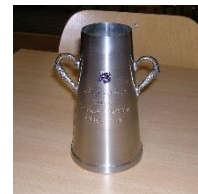
Magnus Persson 400 matcher