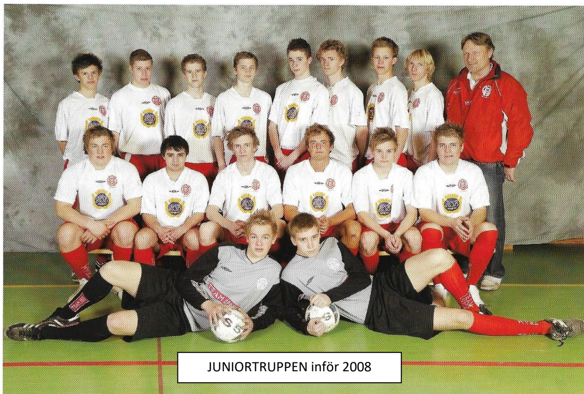
JUNIORTRUPPEN inför 2008