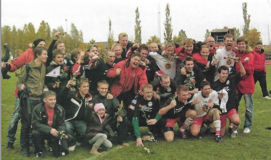
Glädjescener i Häljarps IF efter det att avancemanget till division 4 blivit klart.

Sin direkt avgörande insats gjorde Mats i andra halvlekens första minut då han i situationen efter en hörna uppvaktad av ivriga