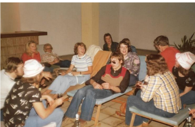
Det blev till att roa sig själva på hotellets takterrass.

Detta var året och veckan när Spaniens diktator Francisco Franco dog. Det innebar att man stängde ner allting och utlyste tre dagars landssorg.