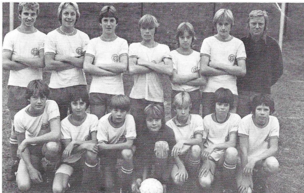
P65B Seriesegrare 1979

Under åren som har gått har man bl a kunnat se att det inte bara är Hälsjars A-lag som rosat marknaden utan även på ungdomssidan har Hälsjarp en verksamhet att vara stolt över."