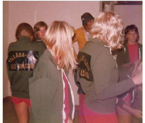
Urklipp från LandskronaPosten