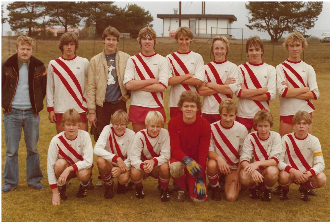
Seriesegrande 16-årslaget 1979

Damlaget klarade tyvärr inte nytt kontrakt utan flyttades ner till div IV.