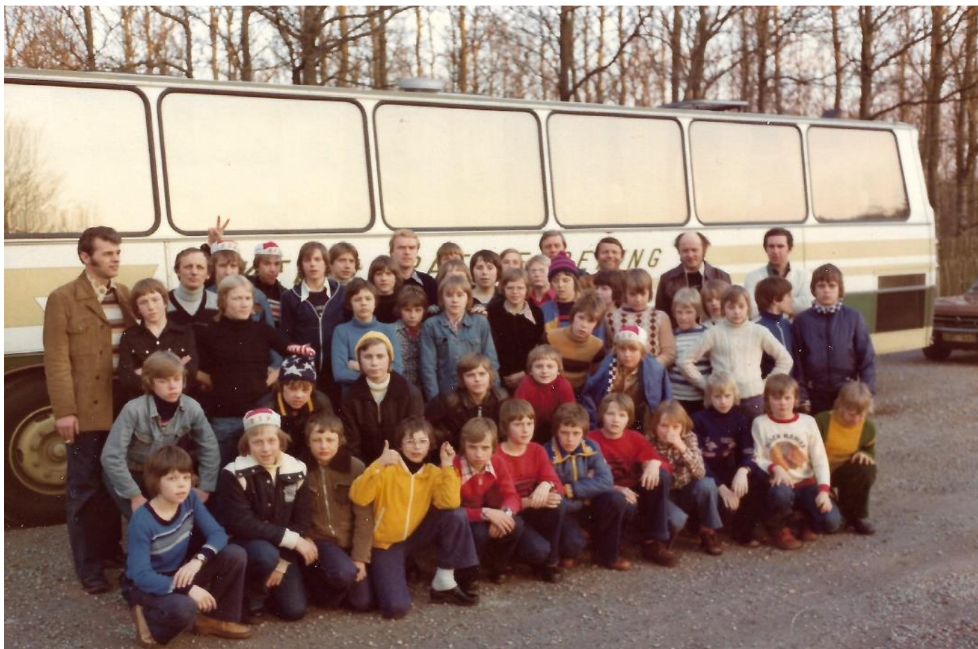
Ett glatt gäng på Hollandsresa.

Dagen efter började man hemfärden, ett uppehåll gjordes i Lübeck några timmar med bl a en rundtur. Väl framme i Häljarp var det ett gäng trötta men mycket nöjda grabbar som steg av bussen till de väntande föräldrarna. Från ledarhåll var man mycket nöjd med pojkarna som hade skött sig fint under resan.