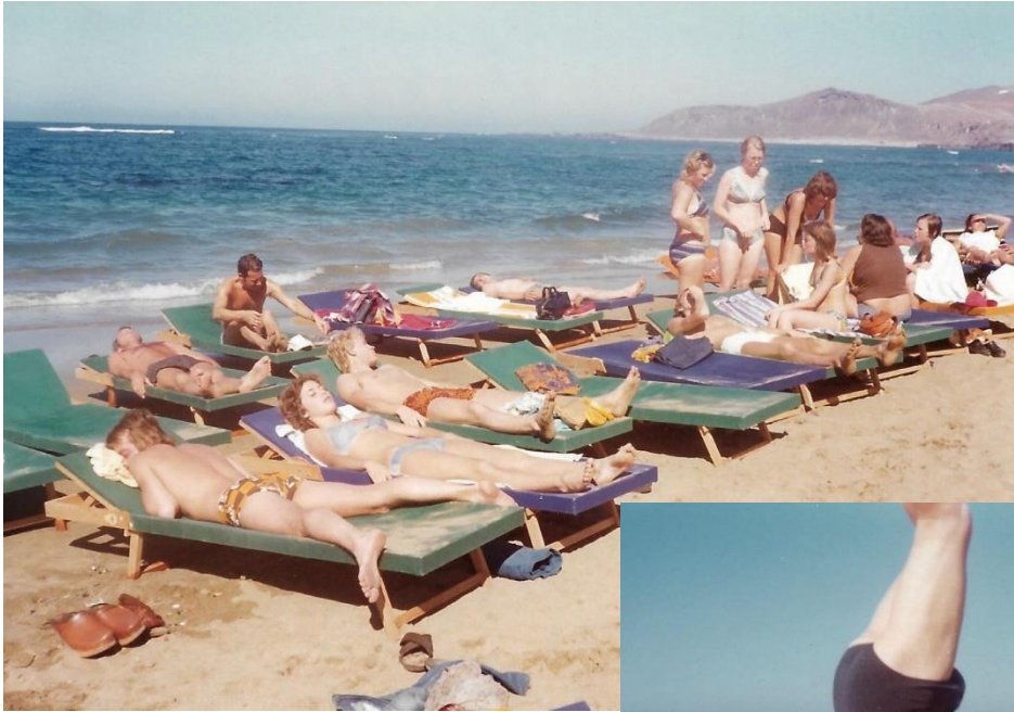
...det var mycket sol och bad....