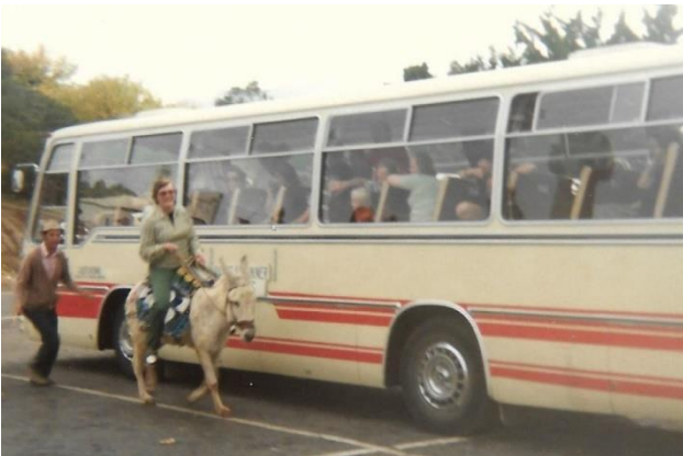
...och man åkte på utfärder.