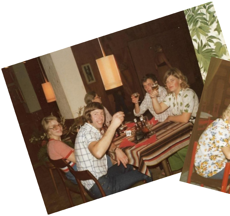
Man roade sig på restaurang....