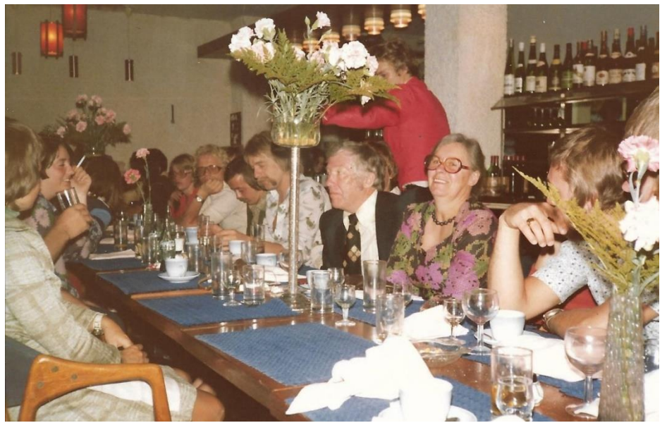
...föreningen bjöd på middag...