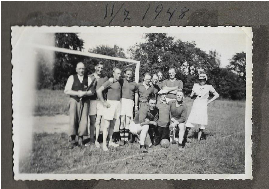
Bild från något sommarjippo

Årsfesten 1949 höll man på Venus lokal i Landskrona och föreningens pojklag skulle serveras gratis kaffe.