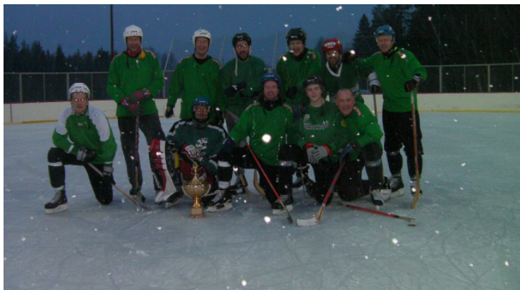
Förra årets vinnare