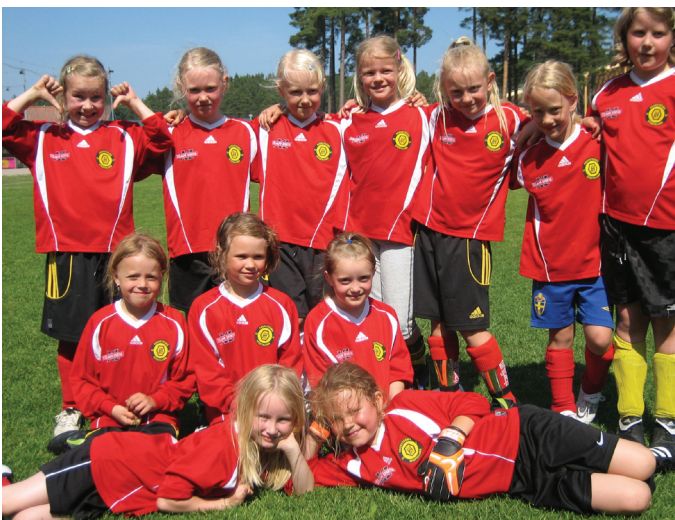
Duktiga flickor födda -03 som just spelat flera tuffa men roliga matcher på Testebovallen i juni.