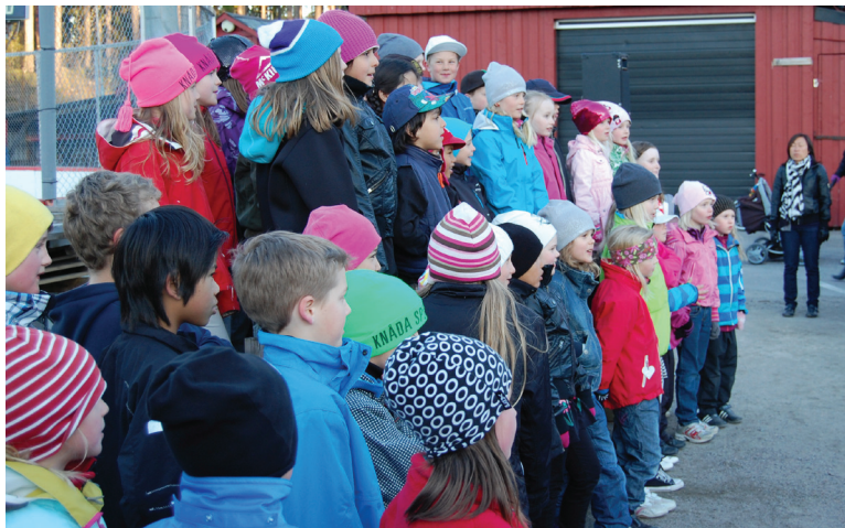
Hagströms skolans barn sjunger fina vårsånger.

I utomhuskaféet såldes det varmkorv med bröd, fika och en massa lotter. Lotterna tog snabbt slut och det är väldigt roligt att det är populärt. Alla vinster till lotteriet är skänkta av företag som vill stödja HSK så intäkterna går oavkortat till klubbens verksamhet.