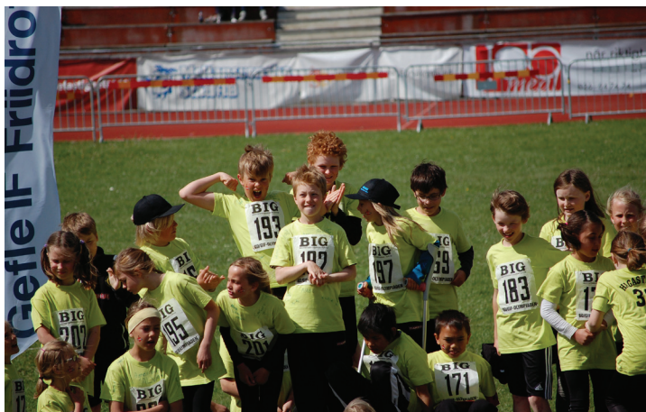
Treorna ett sammansvetsat gäng med kämpaglöd.

I år var det treornas tur att för första gången få medverka på GD/GIF-olympiaden. GD/GIF anordnas på Gunder Häggstadion och i år deltog ca 2500 barn. Det var med stor entusiasm som barnen tillverkade sin klassskylt (häftpistol och spraylimmet höll vi vuxna i men sedan gjorde barnen allt). Lärarna hade ordnat så att barnen fått rita skisser i skolan som vi sedan plockade godbitarna ifrån och ritade en skiss av. Alla bidrog med något och skylten blev väldigt fin. Några av föräldrarna i klassen har tidigare hållit på med friidrott och tog med barnen upp till stadion för en prova-på-kväll. Det var toppen för det var ett gäng pirriga barn som kom till Gunder Häggstadion en tidig lördagmorgon i slutet av maj. Klass 3A och 3B är ett sammansvetsat gäng och har egentligen ingen direkt uppdelning vilket är jätteskoj att se! Efter inmarschen och invigningen var det dags att delta i de olika grenarna. Alla kämpade på sitt vis. Två tjejer deltog på kryckor i alla grenar. Vilken kämpainsats de gjorde för klassen! Alla vi som besökte dagarna var mycket nöjda. Deltagarna tog väl hand om varandra under hela helgen. Klassens lägerplats var också perfekt. Lite i utkanten och bortom allt ståhej inne på tävlingsarenan. Där laddade kidsen med lekar och vila om vartannat under helgen.