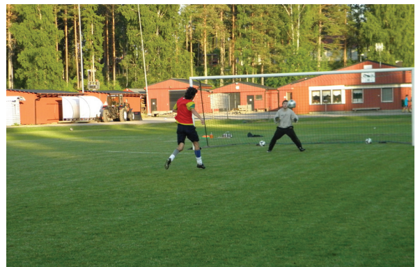
Tränar avslut bland mygg och knott...