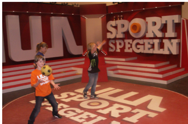
Övning innan direktsändning.