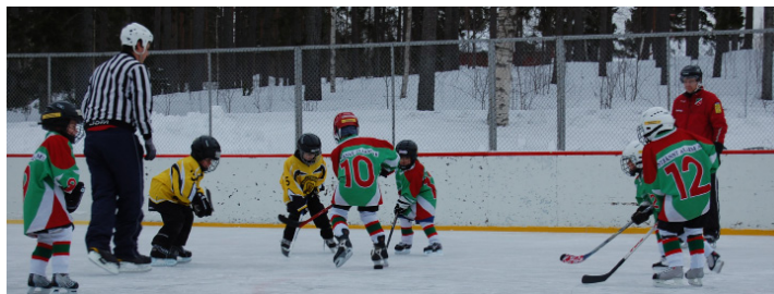
Vem har pucken?

Grunddräneringar, poolgrävning, avlopp, m.m.