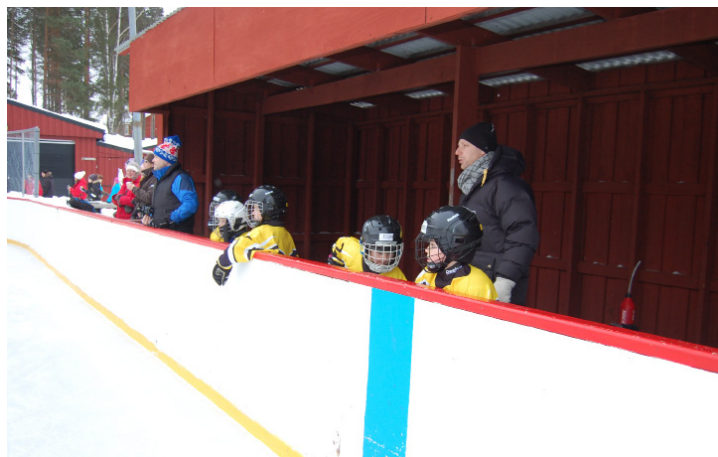
Koncentrerade knattar i båset.

I hockeyskolan spelar man på tvären och med fasta byten efter 90 sekunder. Inga mål redovisas. Domare var en tränare från HSK och en från IK Sättra. Dom visade bl.a. tydligt för barnen hur de skulle stå vid tekningar så att det blev både en lärorik, målrisk och glädjefylld match för alla!