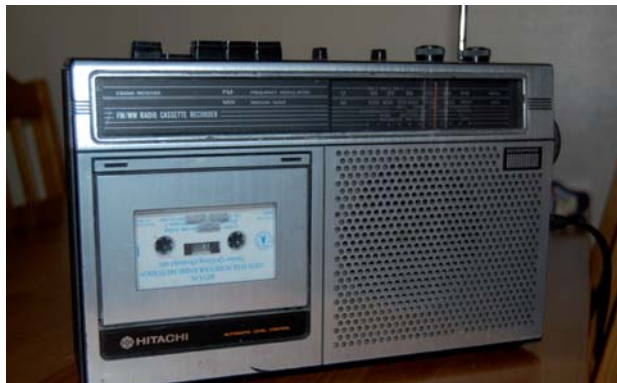
En hederlig gammal bandspelare.

Grunddräneringar, poolgrävning, avlopp, m.m.