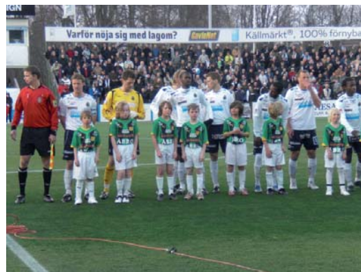
HSK-grabbar i grönsvart!