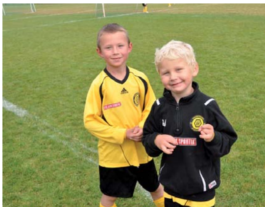
Följer matchen engagerat.