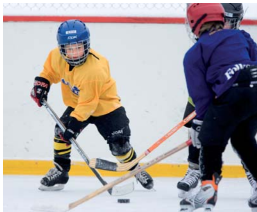
Kämparglädje på isen!

Glädje, Lek och Kamratskap är nyckelorden i verksamheten, där vi försöker att på ett lekfullt sätt lära oss att åka skridskor, hantera klubba och puck samt spela ishockey (med allt vad det innebär).