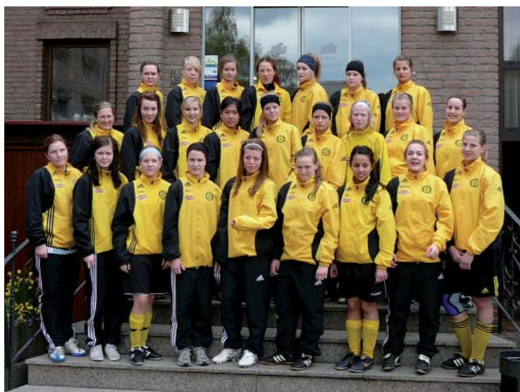
Laget som tog steget upp i division 3.

Inför nästa år ska en ny ledarpärm tas fram för att bidra till att leda våra aktiva spelare, ledare och föräldrar till ett gemensamt mål med verksamheten i HSK.