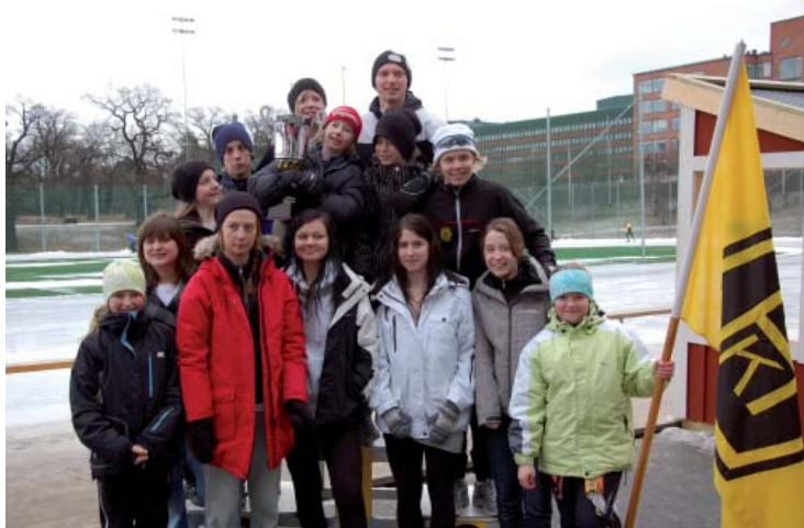
Ett lyckligt gäng som ännu en gång vunnit ungdoms SM.

Trots att Hagström är en liten förening så får vi fram duktiga skridskoåkare. I år hade vi med hela sexton deltagare i åldrarna 12-16 år och vi tog sju guld, tre silver och fem brons. Målsättningen inför nästa år är att vi ska få med tjugo åkare som ska försvara titeln Sveriges bästa ungdomsklubb.