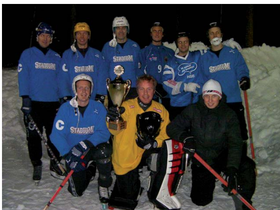
Seriesegrarna - Centrum

Vi har även haft två lag med i Gävlekorpsens rinkbandyserier, men där vi i år inte fick något lag till slutspel. Nu får vi lägga undan skridskorna ett tag, i väntan på nästa säsong, med förhoppningsvis ännu fler deltagare.