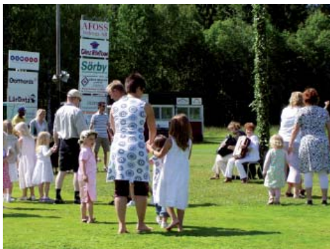
Dans kring midsommarstången nere på IP.

Midsommarstången reser vi vid 15-tiden och därefter startar midsommar dansen! Varmt välkommen att fira midsommar tillsammans med oss.