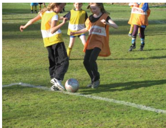
På träningarna jobbar man hårt...