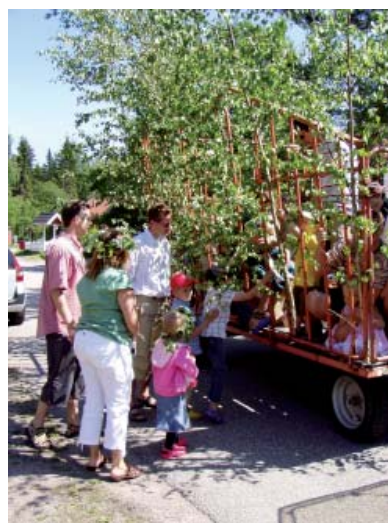
Påstigning på Skogsvägen till traditionell traktortur.