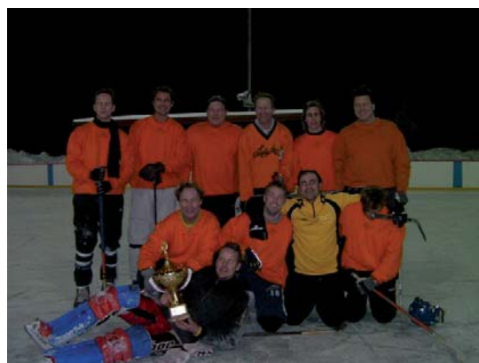
Cupsegrarna - Ådalen