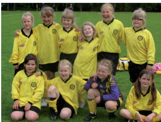
Glada tjejer på Kastvallen