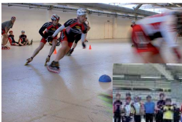
Snabba ryck i kurvorna.