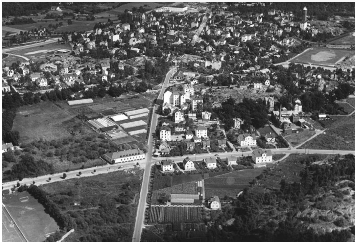
Flygbild över Hagalund från väster 20-/30-tal. I översta högra hörnet Hagalunds IP, i nedersta vänstra hörnet det som snart kommer att bli Råsunda Fotbollsstadion, Råsunda Idrottsplats. Vägarna som korsas är nuvarande Frösundaleden (då Hagavägen) och Solnavägen.

Rivningen av Hagalunds industriområde inleds med husen längs Gelbgjutarevägens västra del. Större delen av området kommer att rivas under det kommande decenniet och ersättas med både bostadshus och nya kontorshus. Omkring 2030 kommer området att ha en tunnelbanestation, Södra Hagalund.