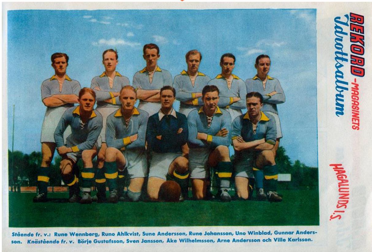
Hagalunds lag i Rekordmagasinet, mitten av 1940-talet.