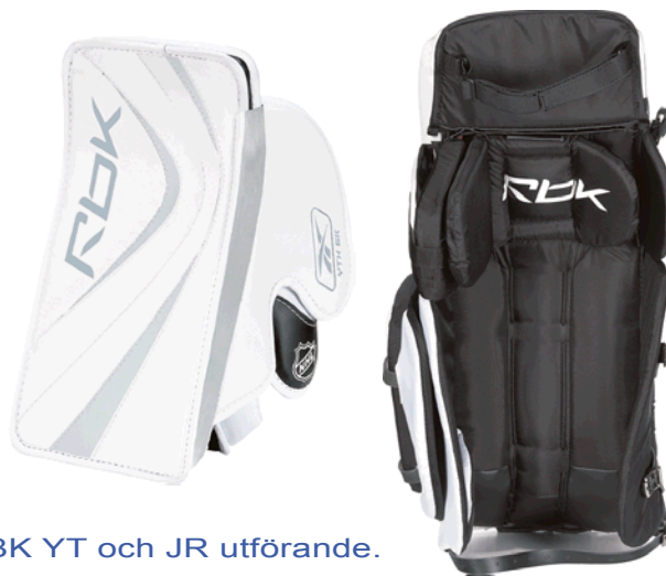
RBK YT och JR utförande.