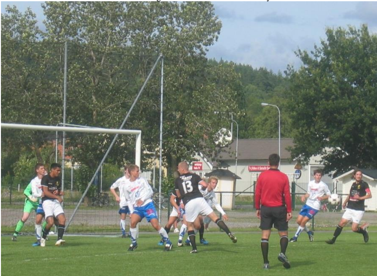
En av många hörnor i Söderköping.