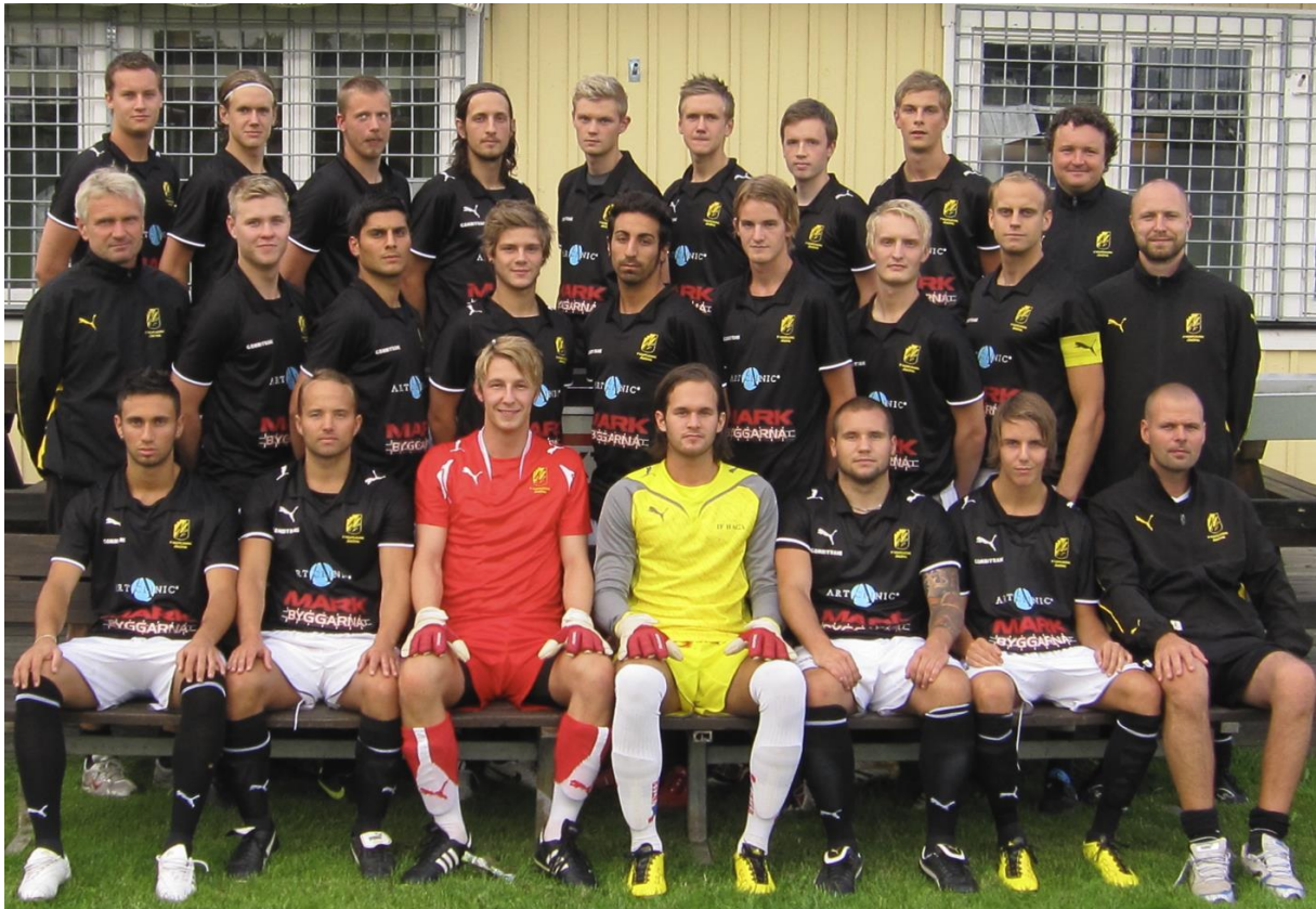
A-lagstruppen inför säsongen 2010.