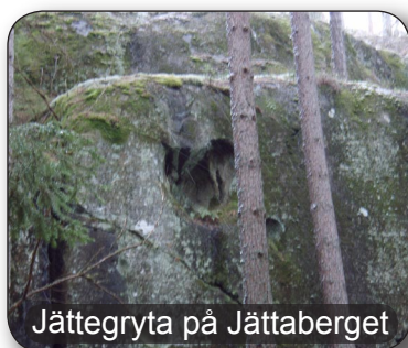
Jättegyrta på Jättaberget