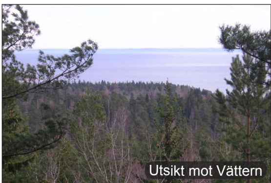
Utsikt mot Vättern

2-3. Efter någon kilometer kommer flera kraftiga stigningar. På toppen av berget finns det en bänk där du kan rasta med en hänförande utsikt över Vättern.