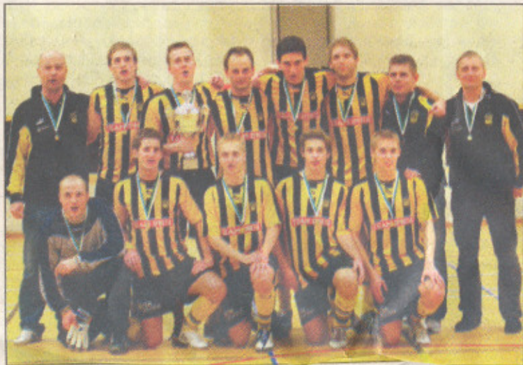
Segerslaget. Göteryds BK skrällde och vann Team Sportia Cup.