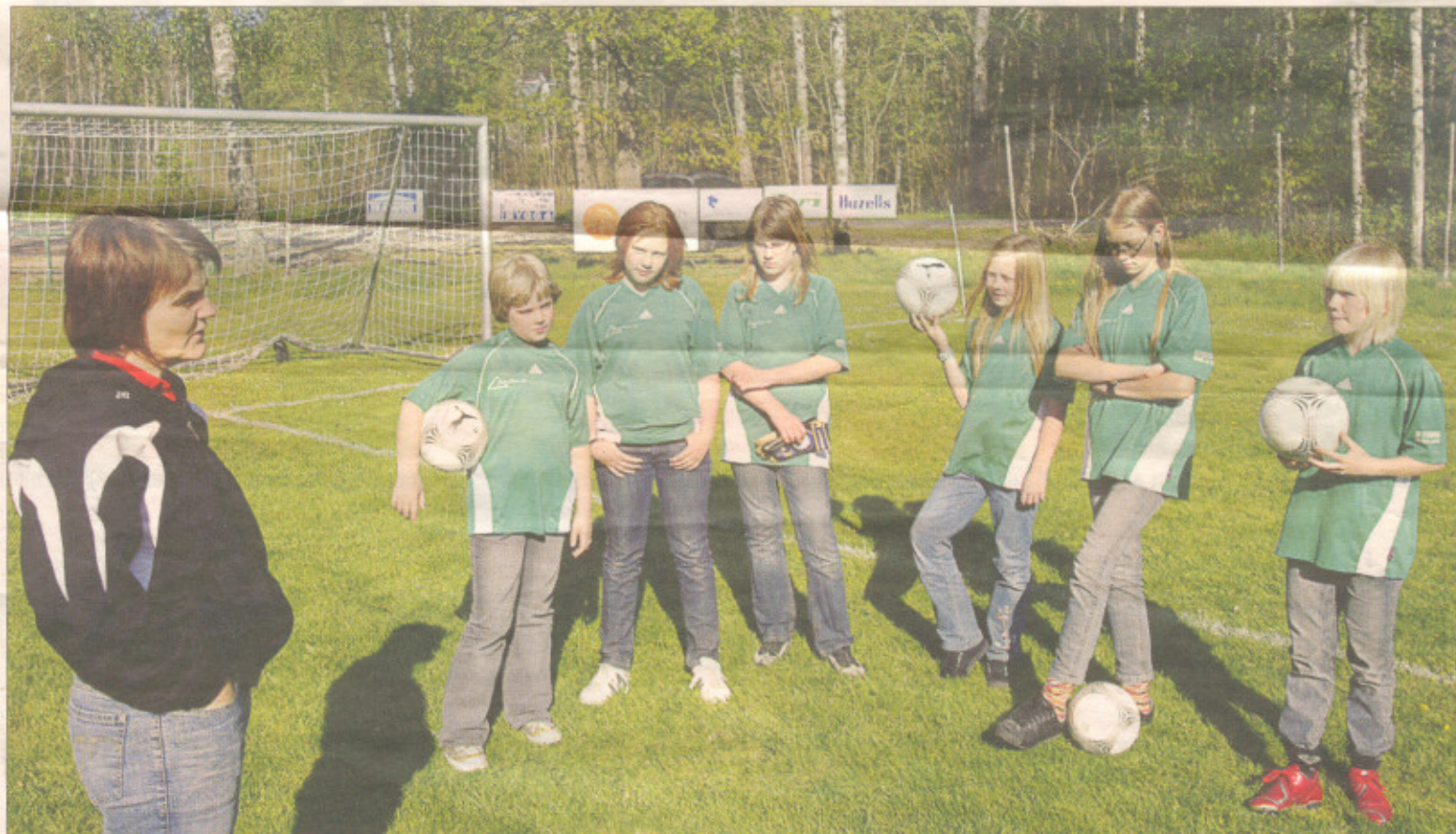
Fair play. F12-laget i Göteryds BK vet precis hur man ska bete sig på en fotbollsplan. Det finns även en policy mot mobbning i klubben men med hjälp av Sisu ska den nu utvecklas.