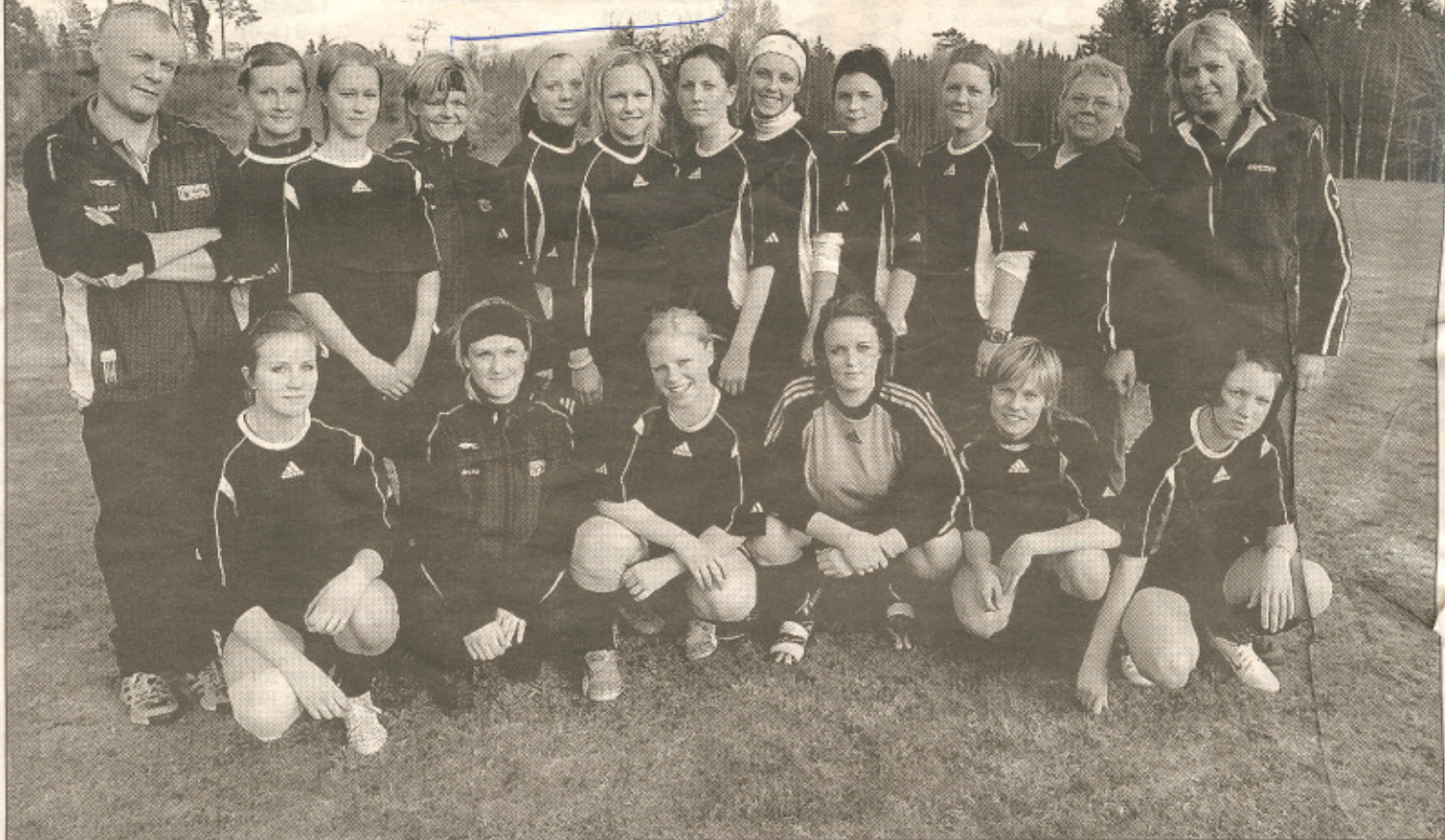
Delary/Göteryd/Hallaryd kom sju förra säsongen i femman. I år är laget bättre tränat och har dessutom förstärkt upp med två rutinerade spelare och hoppas på en mittenplacering.