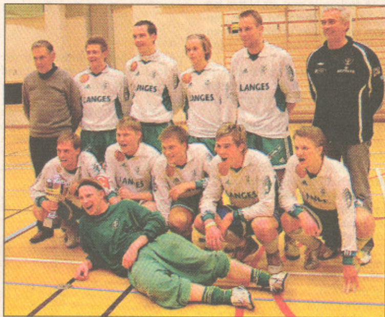
Virestads IF blev slutsegrare i 2006 års upplaga av Team Sportia Sjöfors Cup.