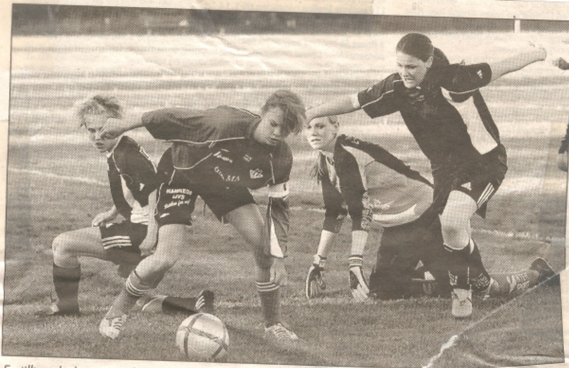
En tilltrasslad situation framför Hamnedas mål i hemmadrabbningen mot DIF/GBK/HIF.