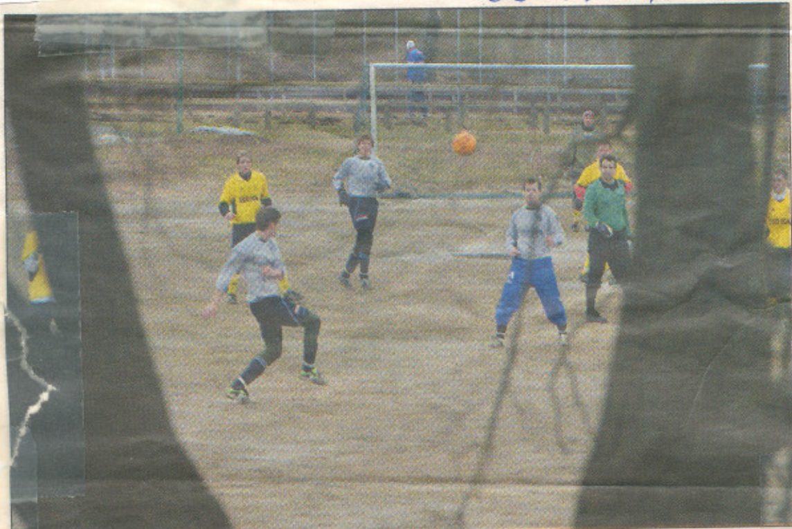
Grimslövspelarna (närmast bollen) hade bra kontroll i Smålandscupen mot Göteryd, som inte kom upp i normal standard.