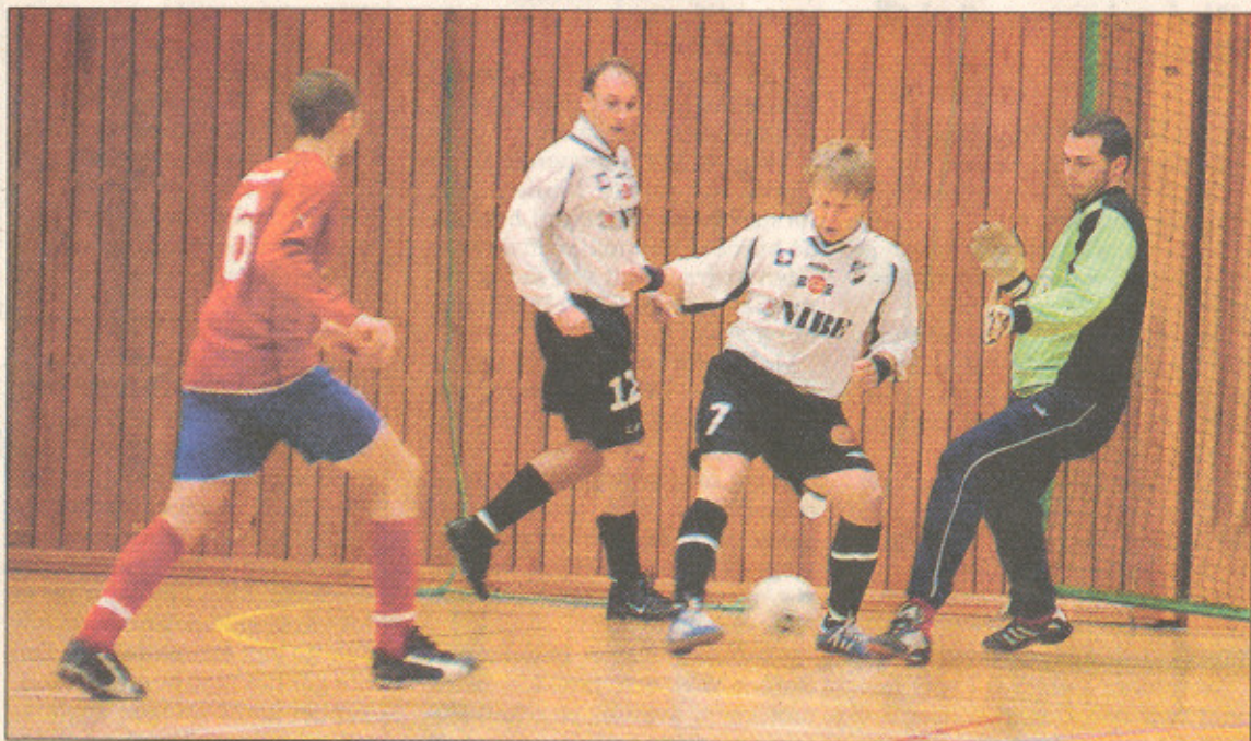
Traryd är till våren tillbaka i div 5-fotbollen. Ett lag som redan hyser respekt för Traryd lär vara Agunnaryd.