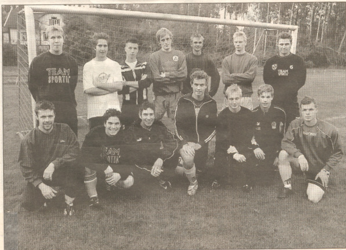
I onsdags genomförde Göteryds BK sitt sista träningspass för säsongen. Och det var idel glada minner i det nyblivna div 5-laget.