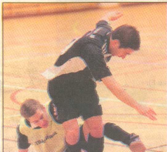
Göteryds BK, här i underläge, var cupens kometa. Leami

De båda gruppsegrarna ställdes sedan mot tvåorna i den andra gruppen under semifinalerna. Men här bevisade de att det var rätt lag som stoltserat överst i respektive serie. Hallaryd slog till