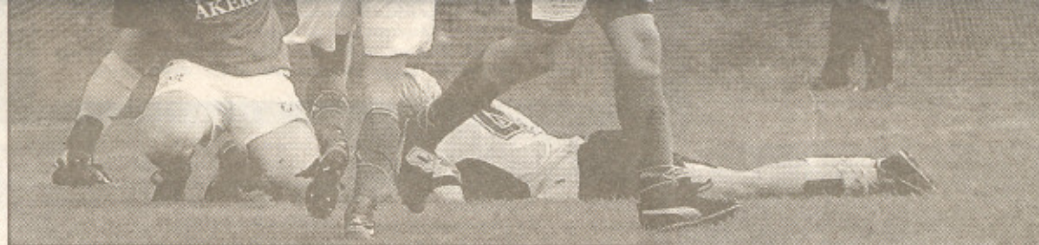
Agunnaryd och Göteryd hade tuffa dueller i år och båda ser fram mot 2004 med höga förväntningar.

Men, det är inte bara negativt på div 6-nivå.