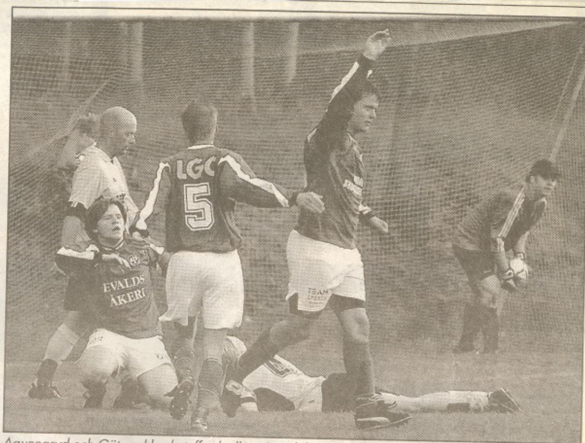
Agunnaryd och Göteryd hade tuffa dueller i år och båda ser fram mot 2004 med höga förväntningar.

Men, det är inte bara negativt på div 6-nivå.