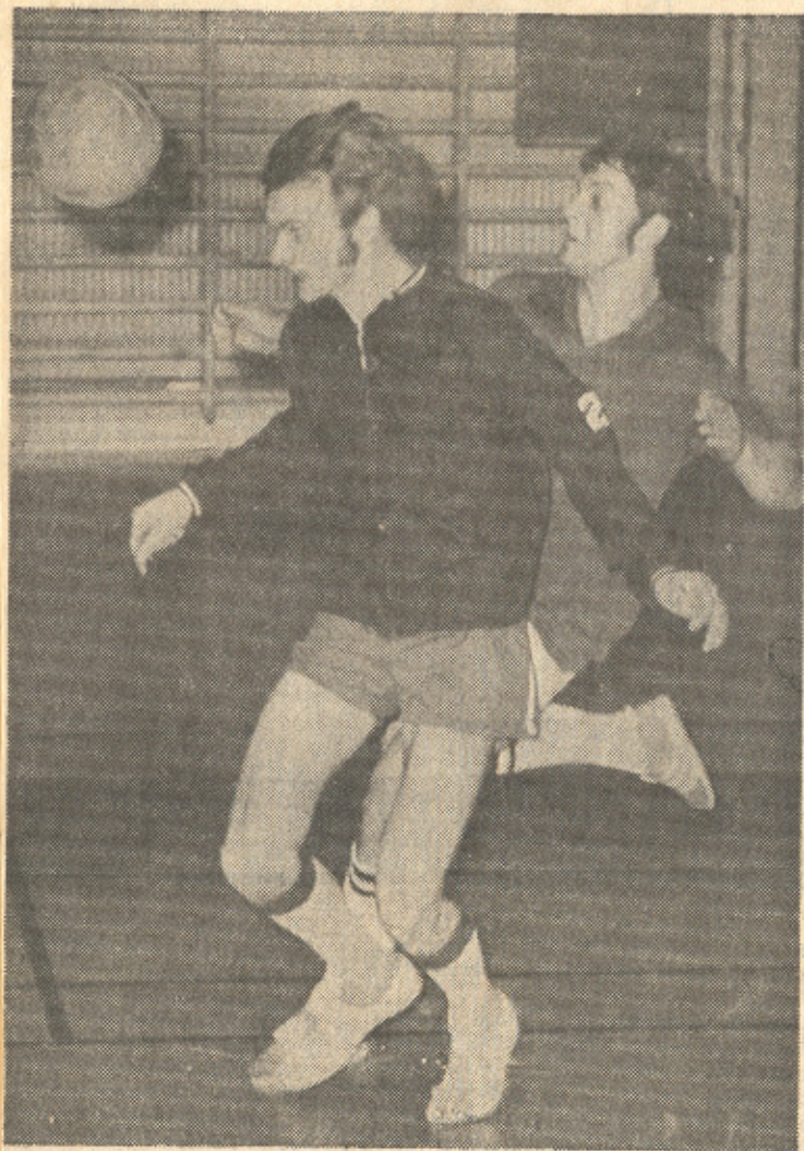
FAR OCH GEIST har det varit över kommunmästerskapet i inomhusfotboll i Älmhult. Final återstår.

Det blir Byggnads och Hallaryd II som kommer att spela finalen i Älmhults kommunmästerskap i inomhusfotboll och alltså ta hem första in-teckningen i Kronobergarens vandringpris. Detta blev klart i veckan, då man spelade samtliga matcher fram till och med semifinalerna. Från