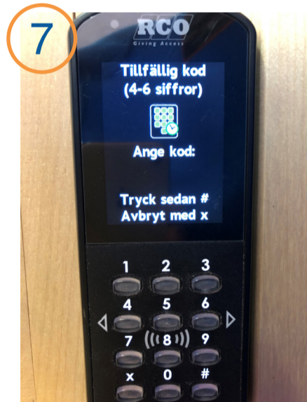
7 Ange tillfällig kod och tryck #