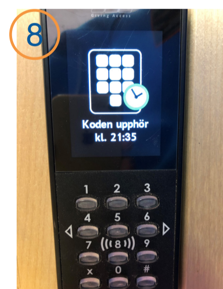
8 Koden försvinner när din bokade tid gått ut