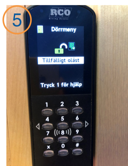
5 Bläddra i menyn med knapp 4 och 6