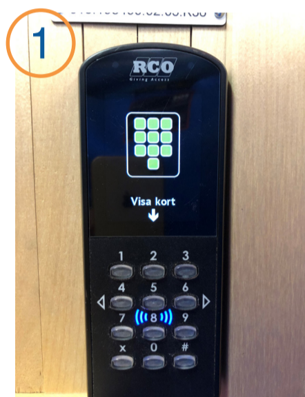
1 Blippa taggen mot läsaren