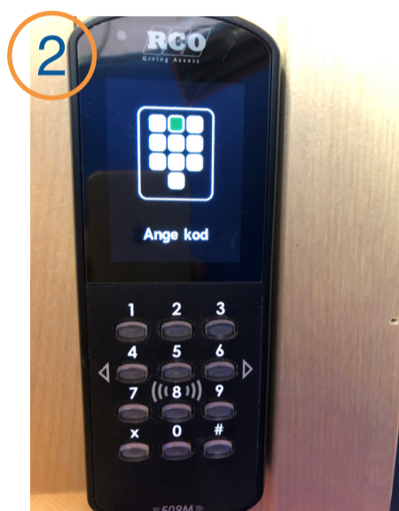
2 Ange din PIN-kod