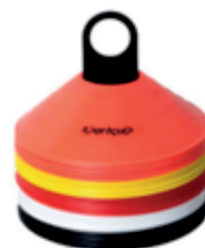
Koner 50st 10st x 5 färger