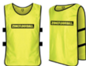
30 träningsvästar (2 färger á 15st) Finns Blå, Röd, Orange, Rosa, Gul