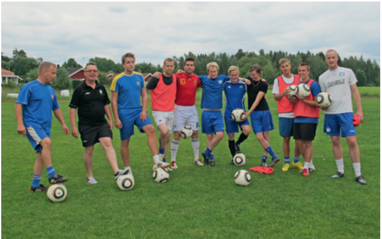
Nio pigga grabbar närvarande vid sommarträningen: (ej i bildordning)