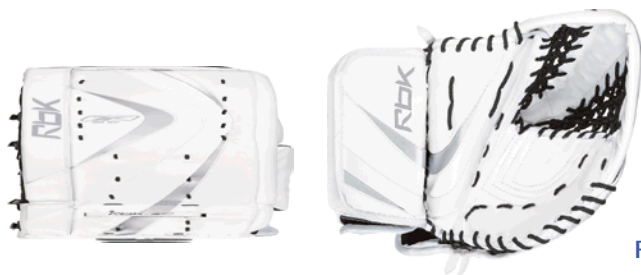
RBK YT och JR utförande.

Svenska Ishockeyförbundet har under några års tid genomfört utbildningar i val av utrustning till ett överkomligt pris utan att ge avkall på säkerheten. För att hitta rätt utrustning har en affisch producerats som också fungerar som kroppslängdsmätare. Skalan är 1:1 med 10-centimeters steg. Affischen visar lämplig utrustning för utespelare och för målvakter.