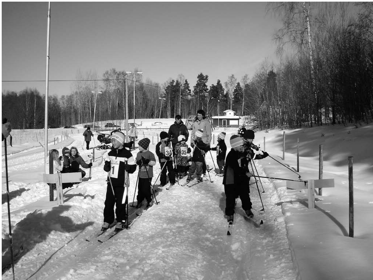
13 unga talanger kom till start i de nypreparerade spåren på Fageråsen.

Barnens Vasalopp är ett samarbete mellan Vasaloppet och Svenska Skidförbundet. Skolor, förskolor, daghem och även privatpersoner kan arrangera skidtävlingen och i vinter har mer än 65000 barn deltagit i Barnens Vasalopp runt om i hela Sverige.