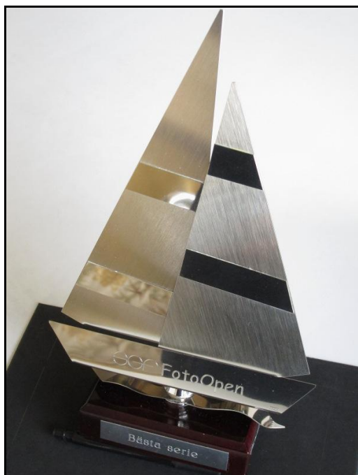
Det åtråvärda vandringspriset väntar på andra inteckningen.

Platsen för årets fototävling blev brukssamhället FORSVIK nära Karlsborg i månadskiftet augusti och september 2012. Denna gång deltog 10 klubbvänner från Fk Pan och Fotografiska Föreningen. Stämningen var på topp och förväntningarna stora.