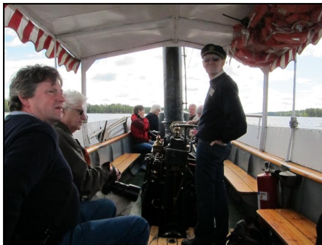
Tyst och stilla stävar vi fram på Dammsjön.