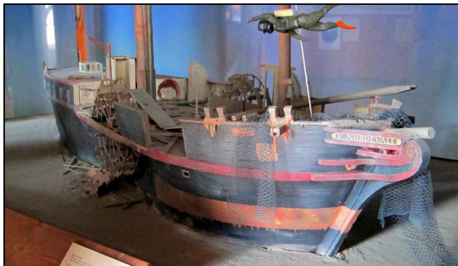
Modell av ångaren Erik Nordevall så som hon ligger på Vätterns botten.

Göta kanal har här sin högsta punkt på denna sidan Vättern och Forsvik blev då för den tiden en livlig och viktig knutpunkt med sin närhet till Karlsborg inte minst.