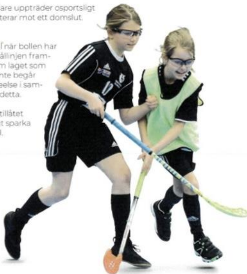
Regler grön nivå – tre mot tre utespelare med målvakt

Det är inte tillåtet att avsiktligt sparka bollen i mål.