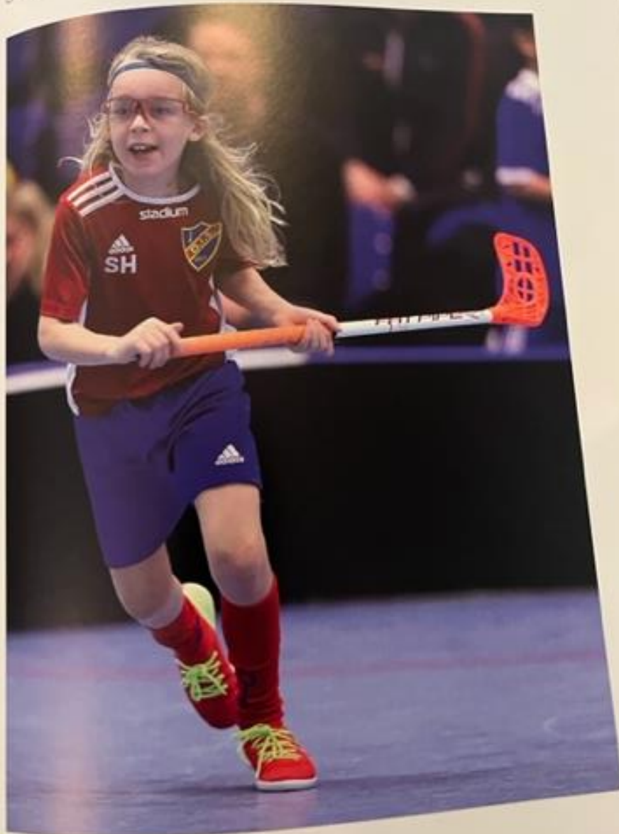
Önster blå nivå – fyra mot fyra utespelare med målvakt

Det blir mål när bollen har passerat mållinjen framifrån och om laget som gör målet inte begär någon förseelse i samband med detta. Det är inte tillåtet att avsiktligt sparka bollen i mål.