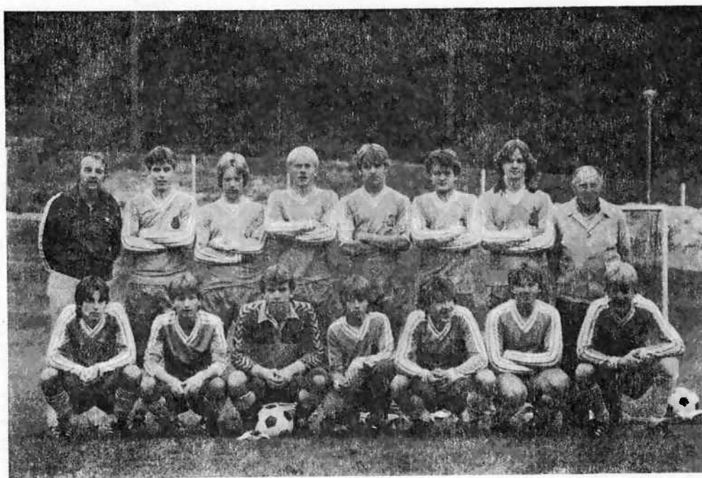
Eds FF:s juniorlag — Seriese-grare och DM-finalister.