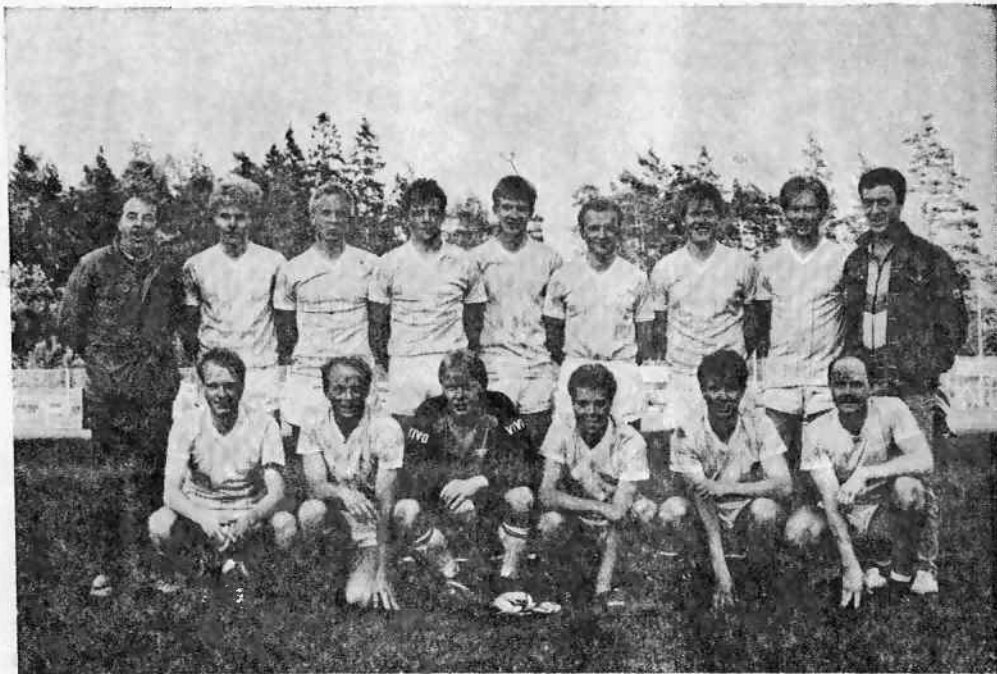
Eds FF:s A-lag — DM - MÄSTARE 1987.