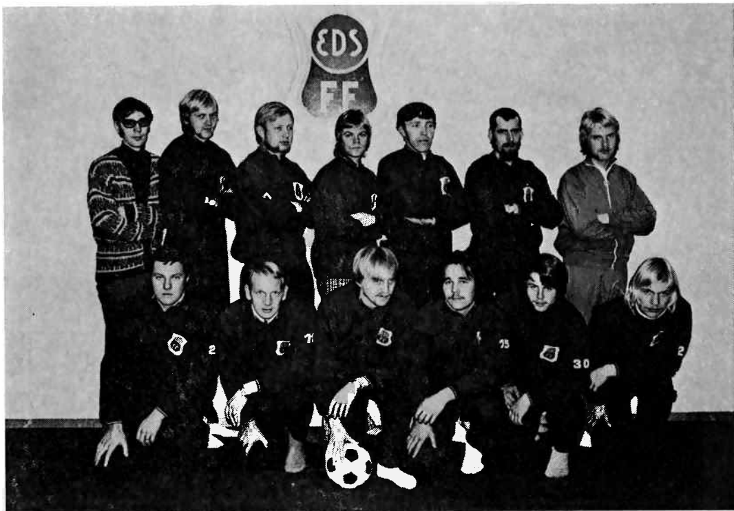
— Eds FF:s reserver 1971 —