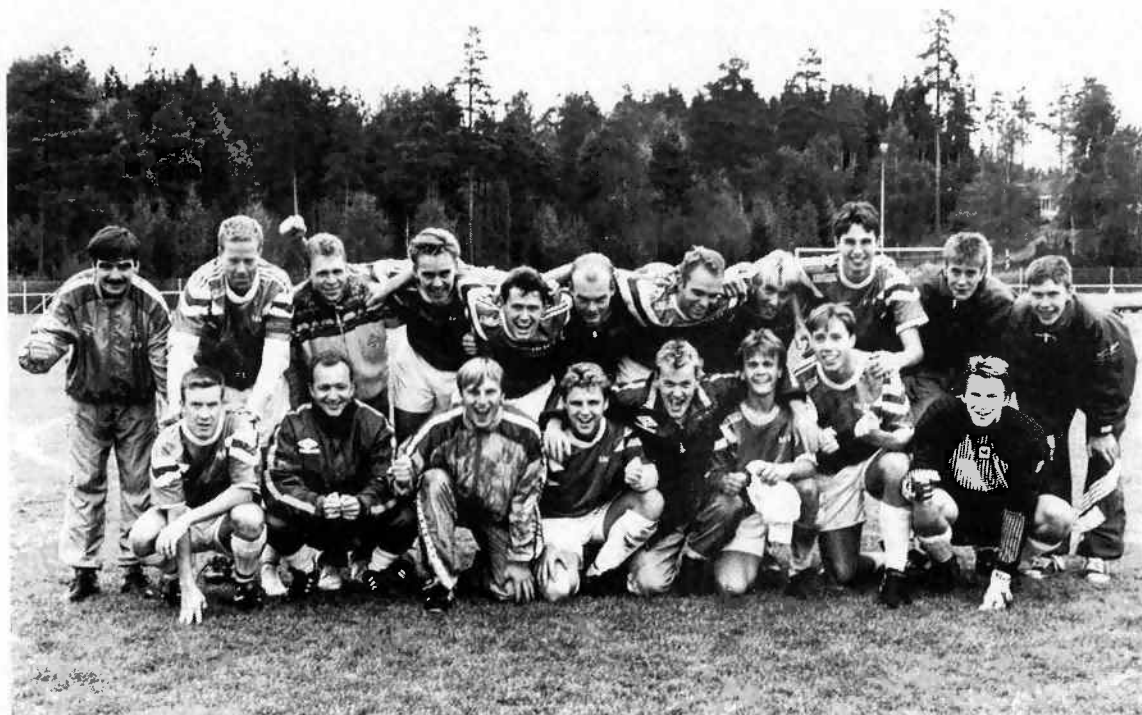
Herrarnas A - lag seriesegrare i Div.V och DM - mästare