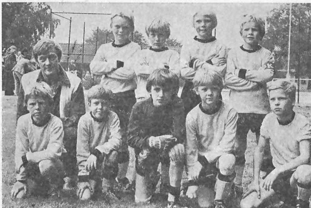
Distriktsmästare i GB - favoritcup, 9 - årslag.