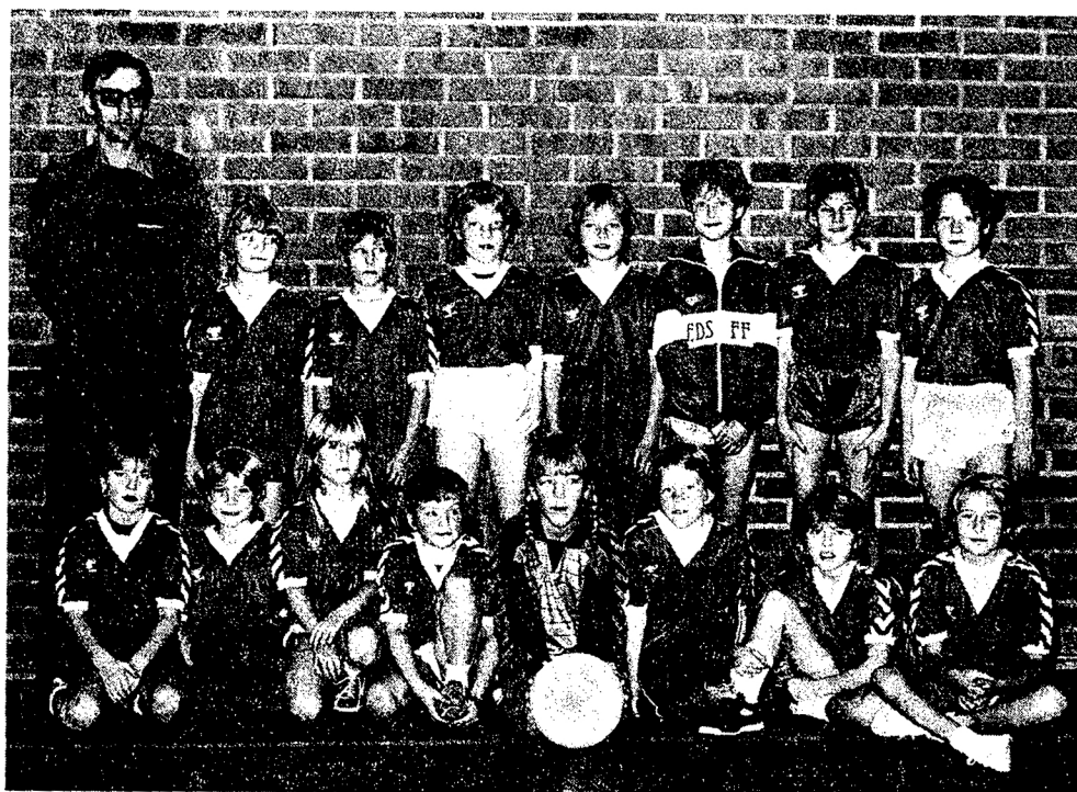
EDS FF:s framgångsrika F 10-lag (Seriesegrare 1985).