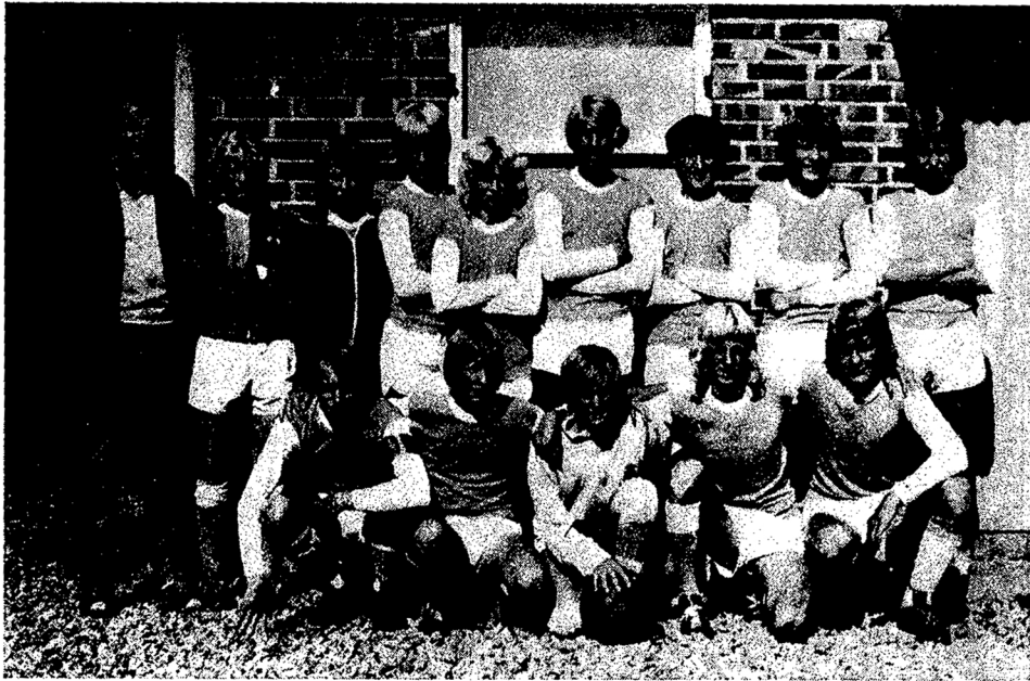
Eds FF:s Pojklag 1973 — Seriesegrare,