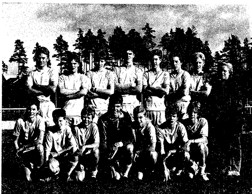
EDS FF:s P-16 -lag Seriesegrare