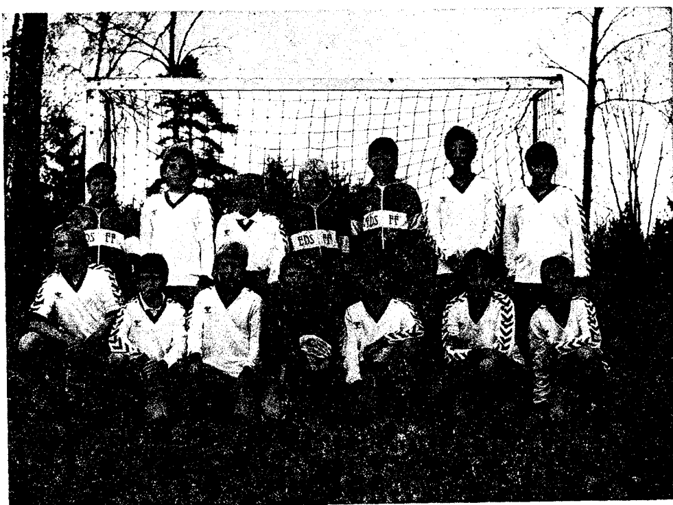
Eds FF:s duktiga P 10-lag — Seriesegrare 1986.