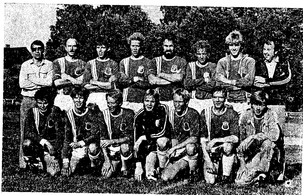
Seriesegrare, Dals Elit 1982.