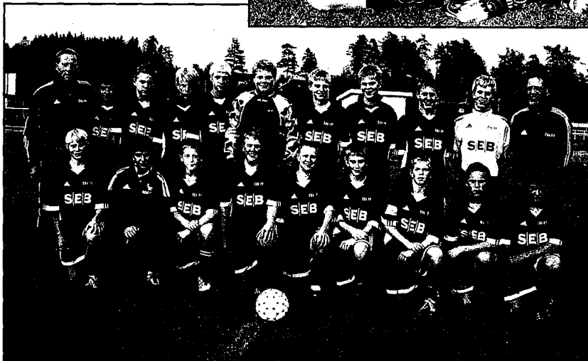
Eds FF P14 seriesegare