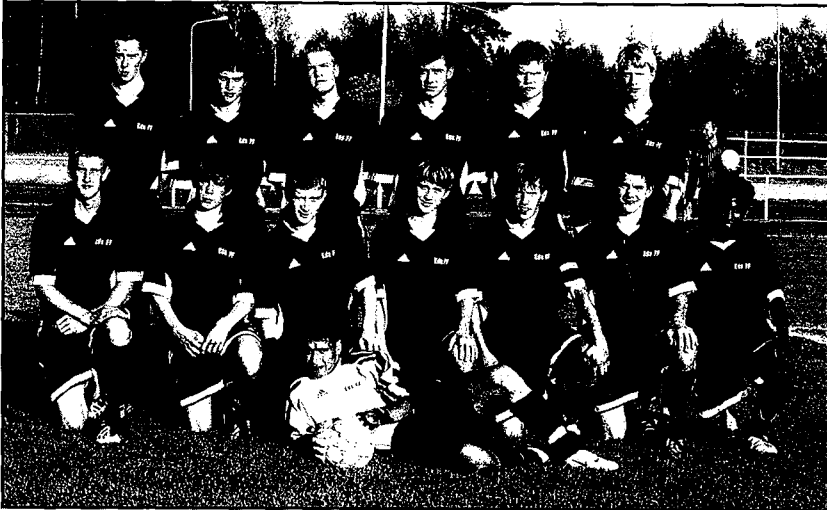
Eds FF Herrjuniorer DM-mästare