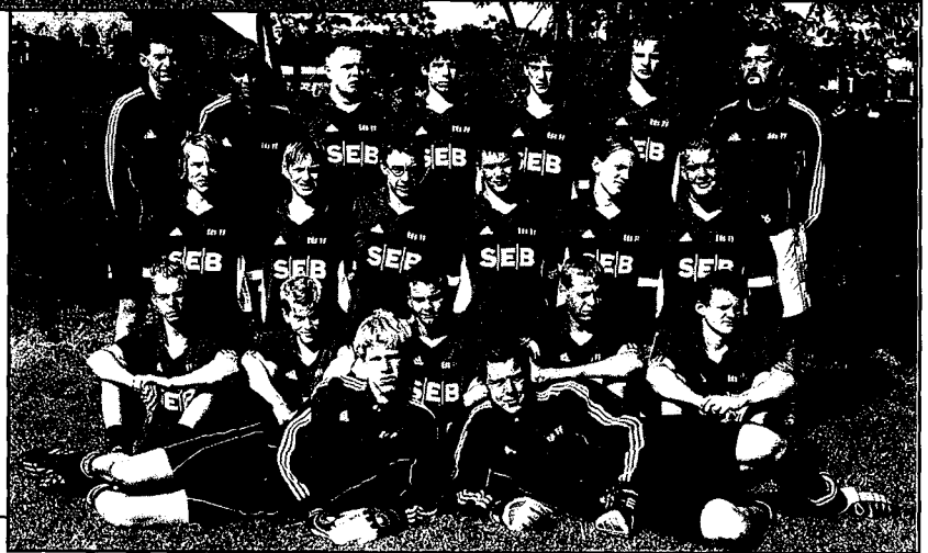
Eds FF P16 seriesegare