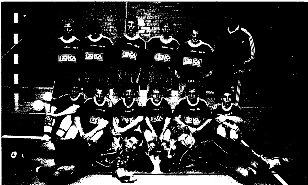
Eds FF P15-16 Seriesegrare