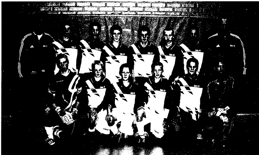
Eds FF P14 Seriesegrare