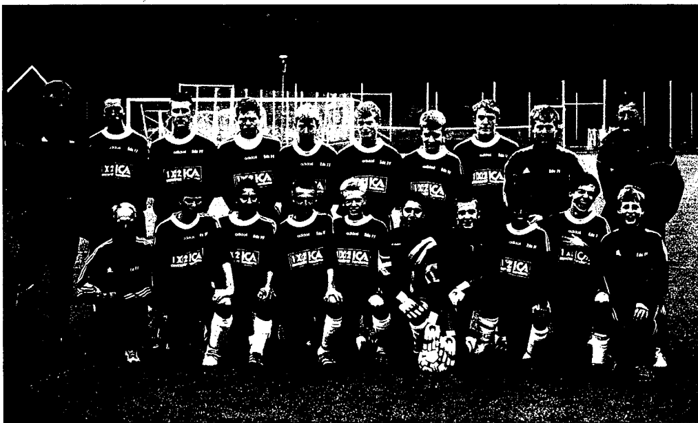
Eds FF P15-16 Serie-segrare