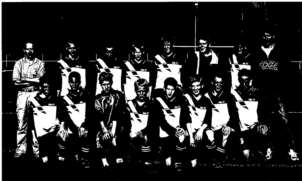
Eds FF P14 Serie-segrare