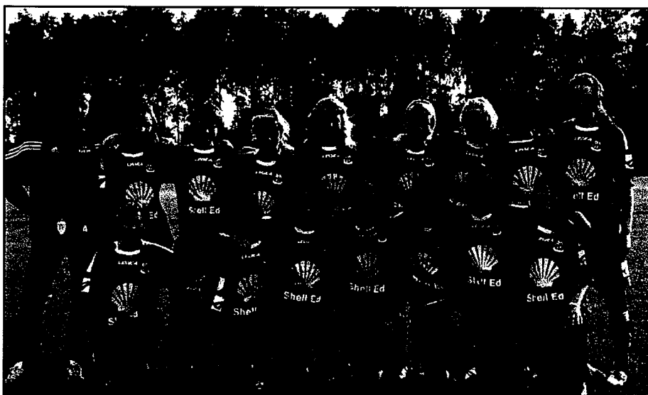
Eds FF F 14 Seriesegare.