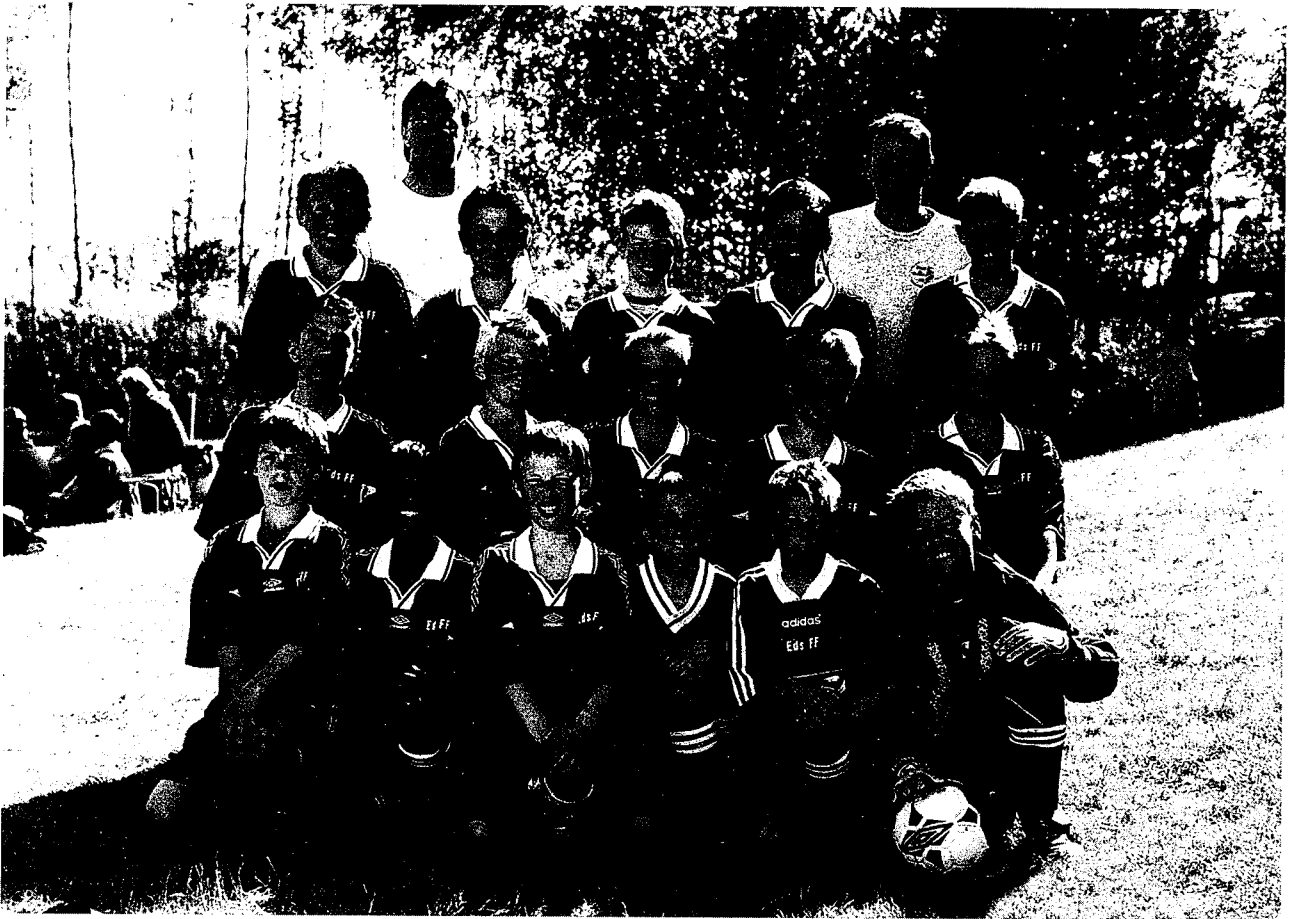
Eds FF P 12 Serie-segrare.