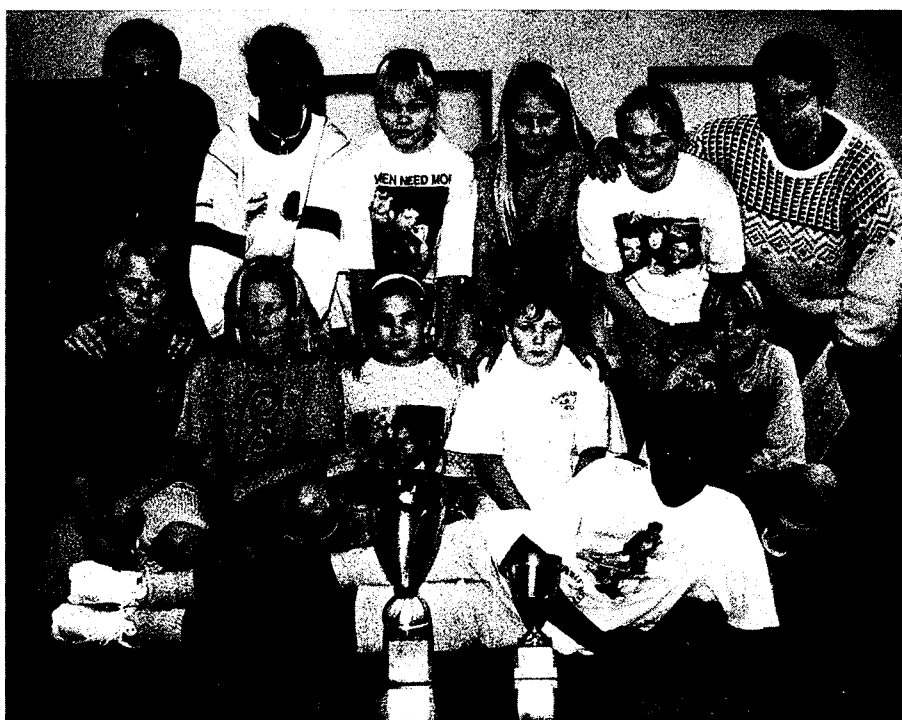
Våra duktiga Cupspecialister F 12