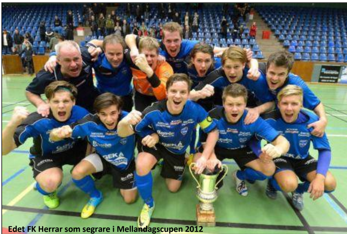
Edet FK Herrar som segrare i Mellandagscupen 2012